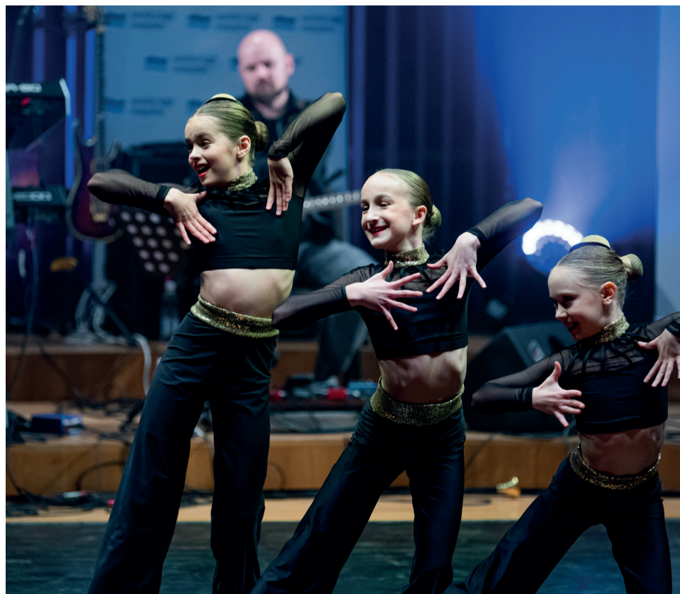
Trio Arabesqua trenują balet, modern i jazz od piątego roku życia