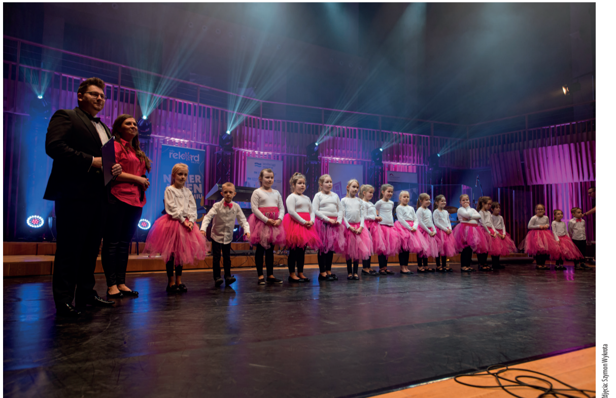
Zespół DO-MI-SOL-KI otrzymał nagrodę publiczności