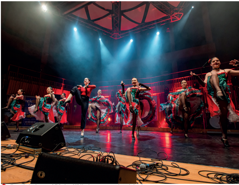
Zespoły Arabesqua i Etiuda z MDK-u brawurowo wykonały kankana