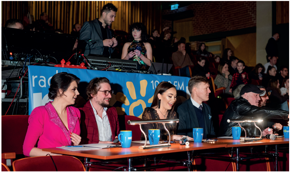
Jurorzy nie mieli problemu ze wskazaniem najlepszych