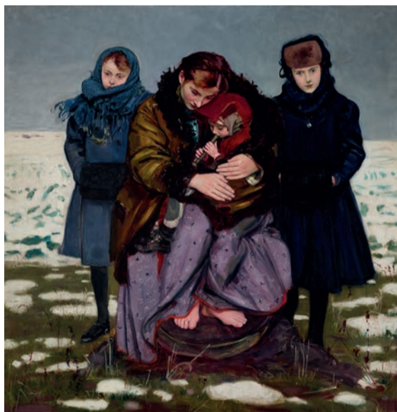
Wlastimil Hofman, „Koncert”, Muzeum Narodowe w Krakowie

Na wystawie „Rok polski” znalazły się dzieła z muzeów narodowych w Warszawie, Krakowie, Poznaniu, Lublinie i Kielcach, z Muzeum Sztuki w Łodzi, Muzeum Śląskiego w Katowicach, Muzeum Mazowieckiego w Płocku, Muzeum Okręgowego im. Leona Wyczółkowskiego w Bydgoszczy, Muzeum Okręgowego w Toruniu, Muzeum Historii Polskiego Ruchu Ludowego w Warszawie, a także z Państwowego Muzeum Etnograficznego w Warszawie i Muzeum Wsi Radomskiej. Są też prace wypożyczone od kolekcjonerów prywatnych.