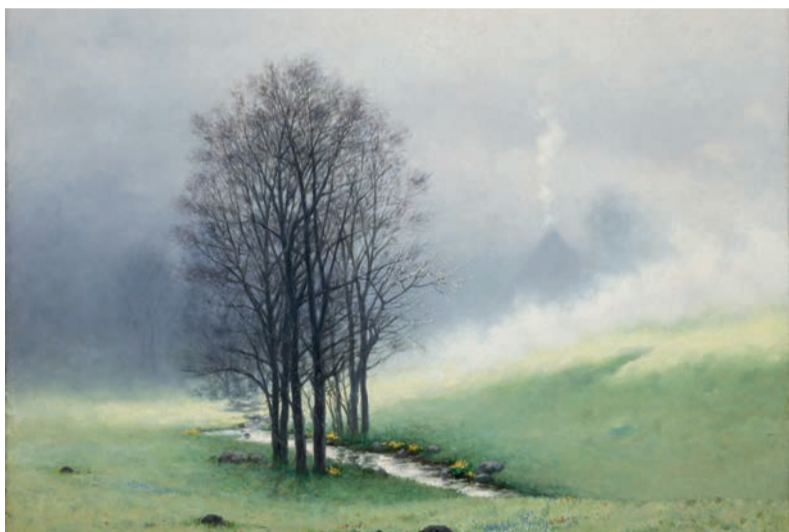
Stanisław Witkiewicz, „Mgła wiosenna”, Muzeum Narodowe w Krakowie

Chelmoński, Wyczółkowski, Axentowicz, Fałat, Hofman, bracia Gierymscy – to tylko część spośród plejady najlepszych polskich malarzy, których prace już od dziś (piątek, 15 września) można oglądać w Muzeum im. Jacka Malczewskiego. Najnowsza wystawa – „Rok polski” poprzez obrazy i rzeźby ukazuje piękno polskiego krajobrazu, kultury, świąt i obyczajów.