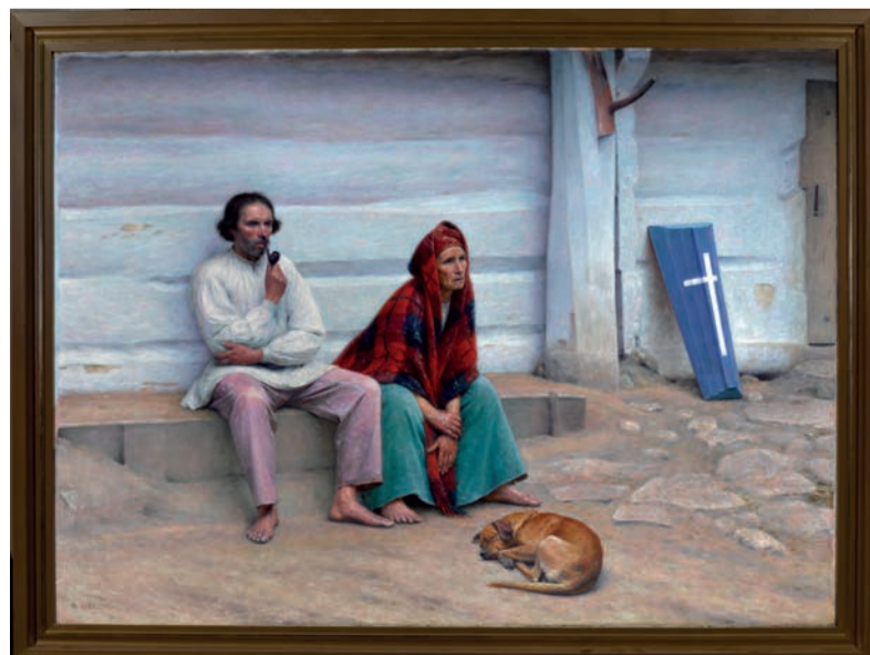
Aleksander Gierymski, „Trumna chłopska”, Muzeum Narodowe w Warszawie

Wernisaż ekspozycji „Rok polski” dziś (piątek, 15 września) o godz. 17. Wystawa będzie czynna do końca roku.